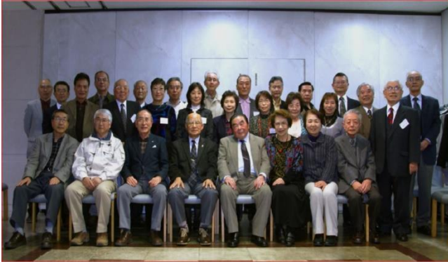
八王子映像へ入会しすぐに記録担当になる