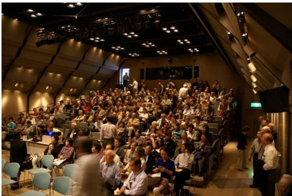
映 像 祭

映像祭で記録ビデオ 毎年映像祭ニュースを例会にて発表する パソコンの技術を利用して会のホームページを担当する。