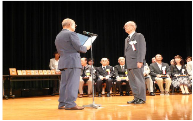
平成 25 年（2013）チャレンジ賞授章