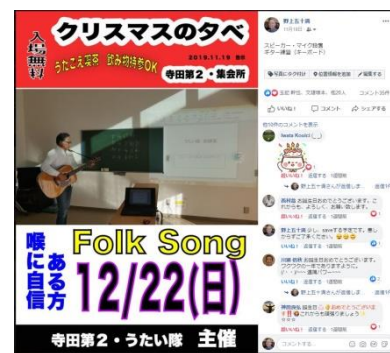
寺田第2の掲示板に掲示済み

今月はクリスマスの夕べと題してギターで歌を歌うイベントを仲間と企画し現在特訓中です。SNS時代なんですね。ネットを活用し情報を上手に発信しながら自分を成長させてゆくことが現在の生活の知恵なのです。誰だってひのき舞台上で活躍したいと願って仕事をしています。アマチュアの映像からスタートして現在はプロとして社会の中で一番必要なビデオ屋・これからも指導を受けながら活動を続けて行きたいと思っておりますのでどうぞよろしくお願い申し上げます。12月26日の忘年会でお会いしましょう。