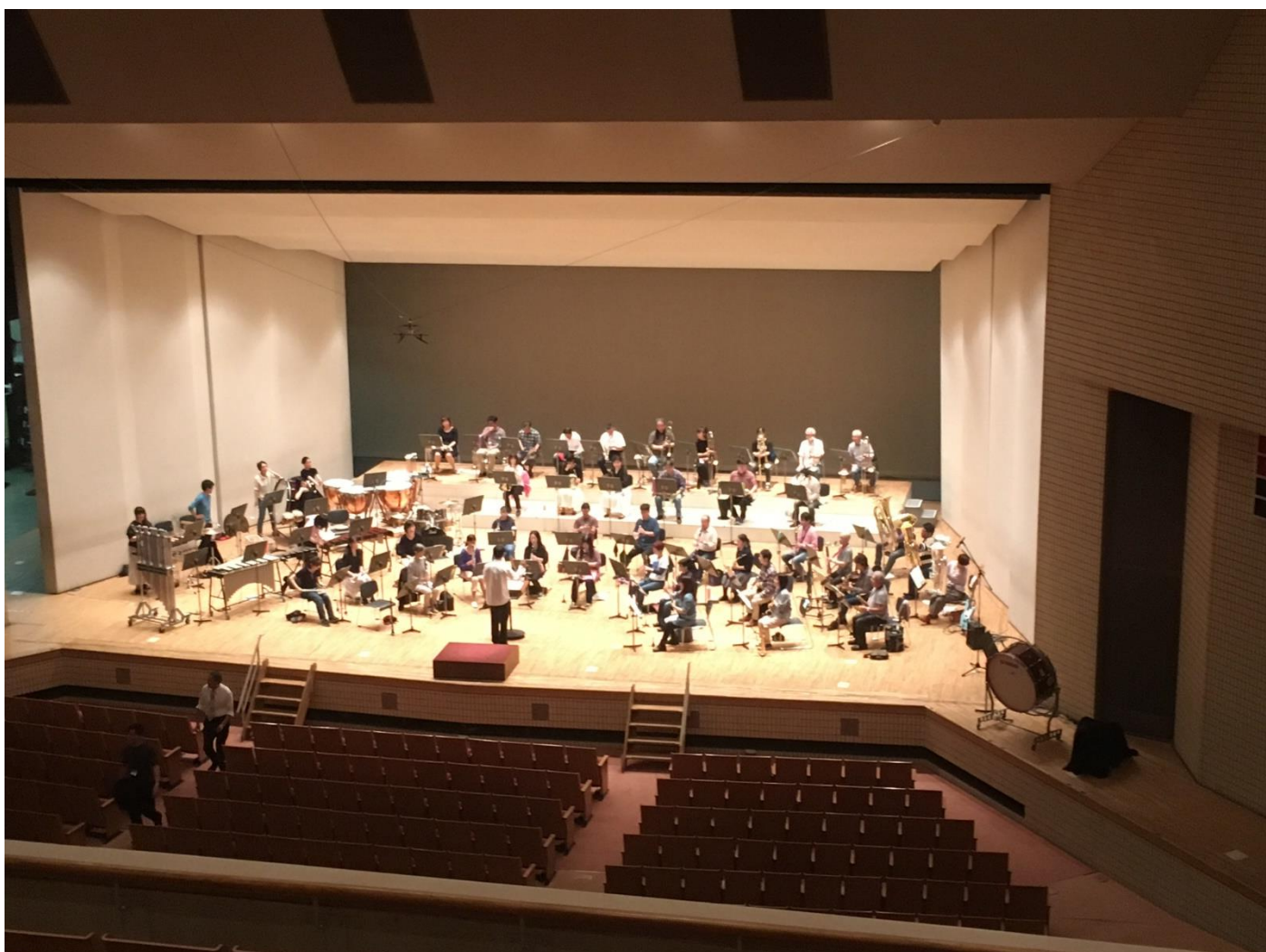
ビデオ撮影（板橋区立文化会館）