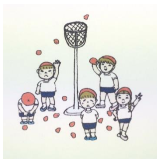
運動会・イベント撮影